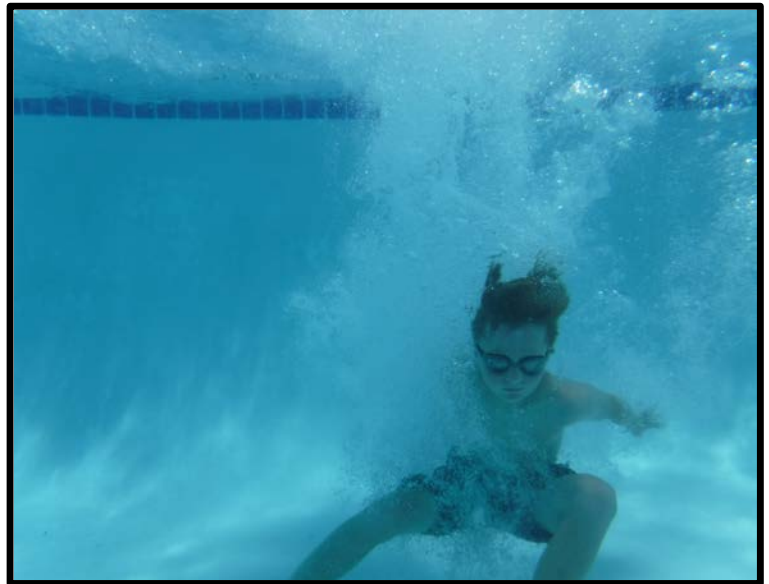
“Burbujas” by Mitra Marchuk